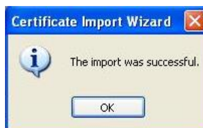
Слика 2. Порука о успешној инсталацији